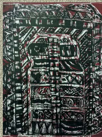
Теодора Живковић и Ана Чичић