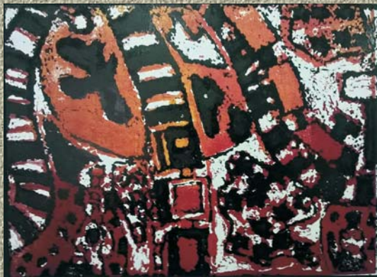
Верица Бузовић и Ана Нешић